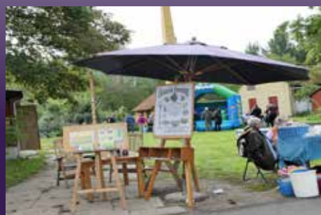
Krudtværksfestivalen september 2018

Foreningen havde sat en stand op ved vores tilholdssted "Patronmagasinet". Standen var godt besøgt, og mange programfoldere mm. blev delt ud til interesserede.