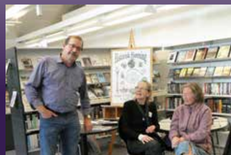
Halsnæs Bogfestival oktober 2018

Biblioteket havde indbudt foreningen til festivalen. Det var en stor oplevelse både at deltage og se og høre de aktive kunstnere. Det blev også til en god snak med flere af de flinke mennesker, der henvendte sig til os og spurgte ind til foreningens aktiviteter.