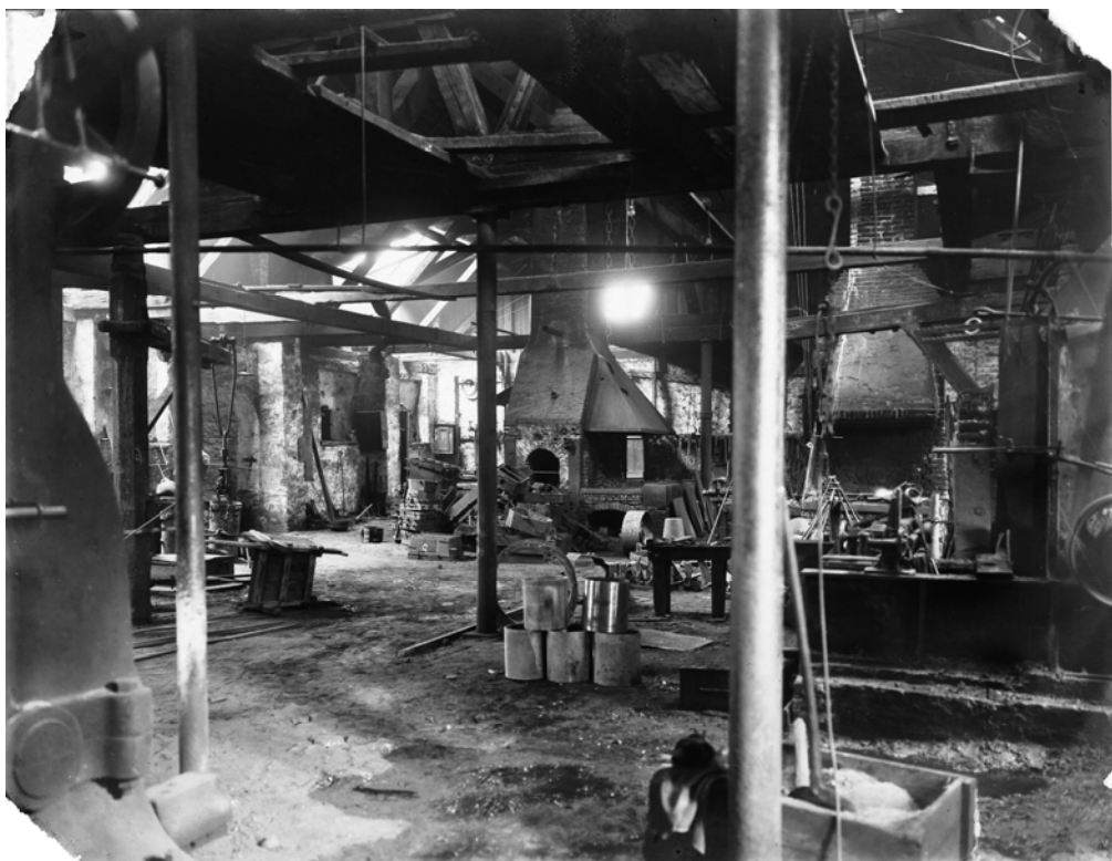
Smedjen i 1925

stille pierriers , lette kanoner til flåden, morterer og artillerikanoner på op til 64 pund [kanonernes kaliber blev betegnet ved kanonkuglernes vægt]. Kanonerne var af jern, smedet ved store hamre, drejet og udboret.