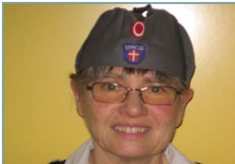
Gurli anno 2009 med DKB hue.

Så kom freden. Næste morgen blev jeg af borgmester Thøgersen anmodet om