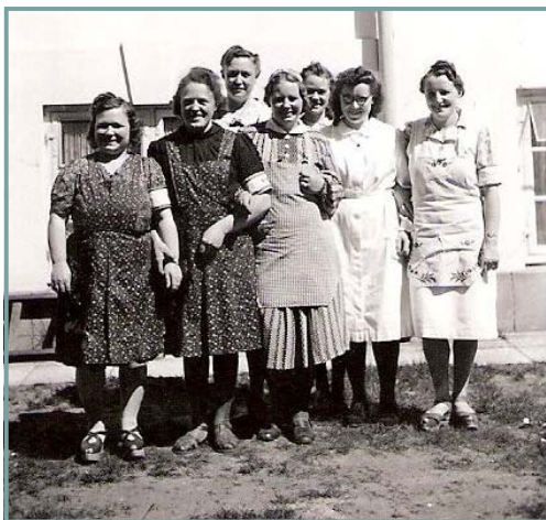
DKBerne som køkkenpiger på Arresødal i 1945