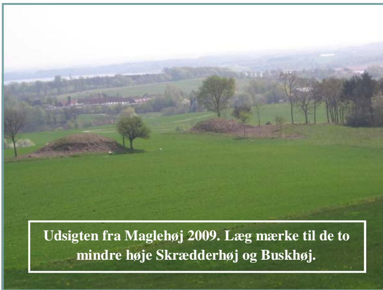
Udsigten fra Maglehøj 2009. Læg mærke til de to mindre høje Skrædderhøj og Buskhøj.

”Jeg gik derhen og steg op på en mægtig kæmpehøj, der var på toppen af det. Og ganske rigtigt, herfra kunne jeg iagttage, at alle de højdedrag der var udsigt til, lå under horisonten og følgende lavere – Hvilken herlig udsigt! Sveriges kyster, Kattegat, Roskilde Domkirke, Frederiksborg. Jægerspris etc.”!