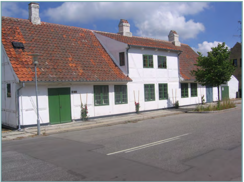
Det fredede hus i Strandgade 12 fotograferet i juli 2010,