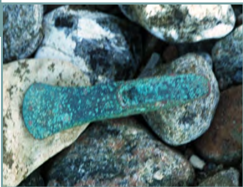
Bronzealder økse fundet på stranden ved Spodsbjerg.

Vi nåede ikke frem til alle de steder, som Espen gerne ville have vist os, men da klokken næsten var blevet 22 og mørket var så småt, sammen med regnen kommet, så vi kunne slutte og med tak køre tilbage til nutiden. En rigtig god oplevelse rigere.