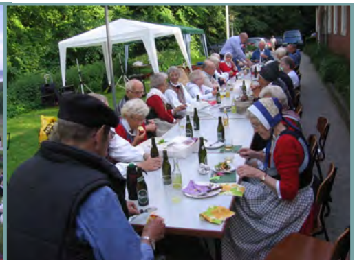
Skt. Hans festen 2010.