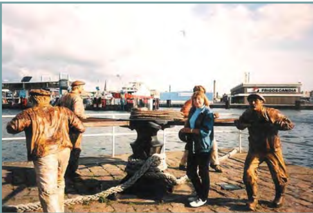
Spillet med træmændene og fotografen og med lodsstationen i baggrunden.

Jeg har talt med personalet på Lodsstationen og fået bekræftet, at det har stået på den samme plads lige siden.