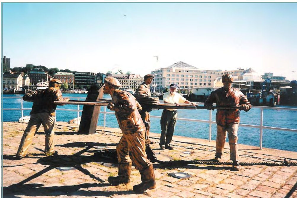
Her giver forfatteren et nap - det er ham med den blå kasket

havde indtil statsbankerotten i 1813. Herefter blevet det drevet videre af forskellige ledere og med skiftende held. Frederik VI døde i 1839, og arvingerne ønskede ikke at beholde Værket, som derfor blev overtaget af Staten i 1846.