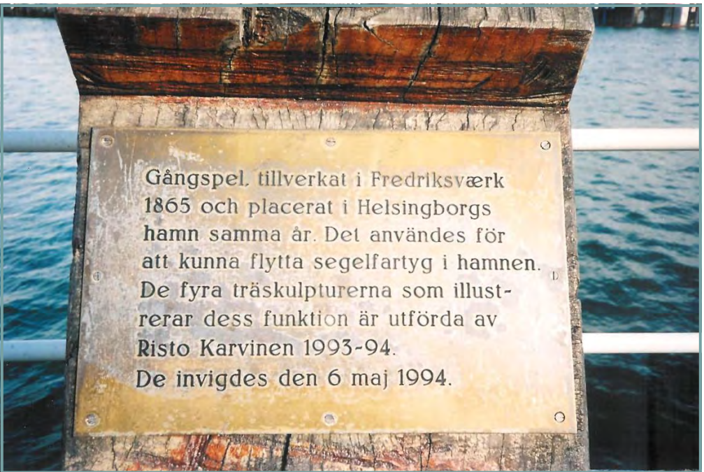
En opstillet tavle ved spillet fortæller, at spillet er fremstillet

nysgerrighed blev vagt af en opsat tavle ved spillet. På den står, at spillet er fremstillet i Frederiksværk i 1865 og opstillet samme år.