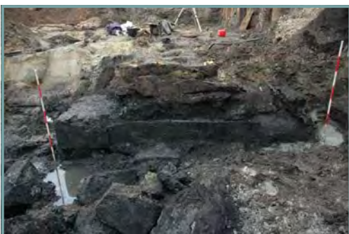
Fra udgravningerne ved Torvet 2008.