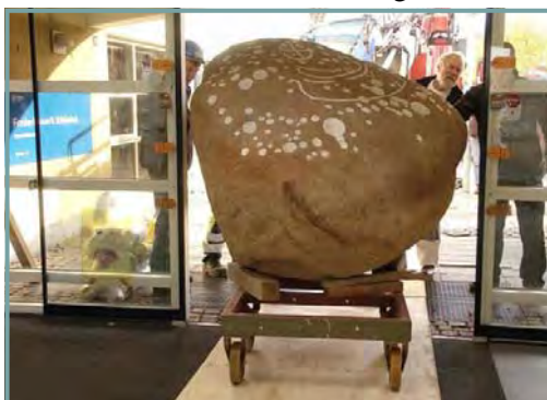
Stenen skubbes ind gennem døren. Der er kun få centimeter at give af.