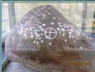
Hylligebjergstenen på plads den 18. november 2010.