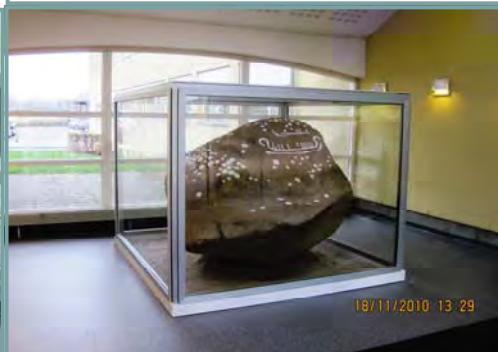
Det færdige arbejde den 18. november 2010, kl.13.29