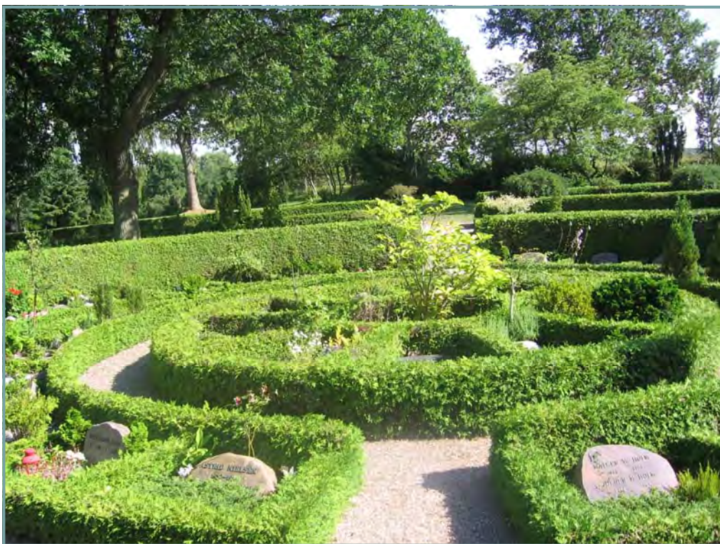
Den meget smukke Vinderød Kirkegård 2010