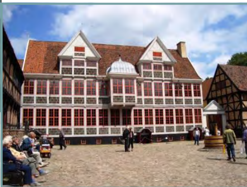
Møntmestergården opført i København i 1683. Den blev revet ned og genopført i Den Gamle By i Aarhus.