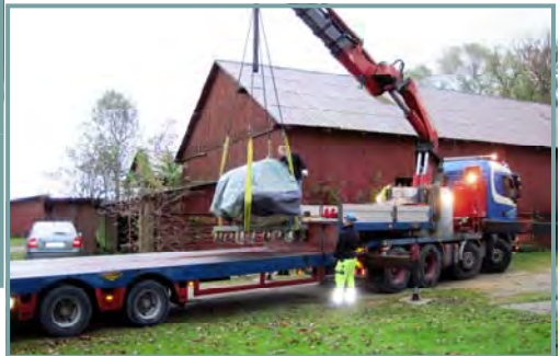
Stenen læsses på blokvogn ved magasinet i Hillerød den 20. oktober 2010, kl. 08.18