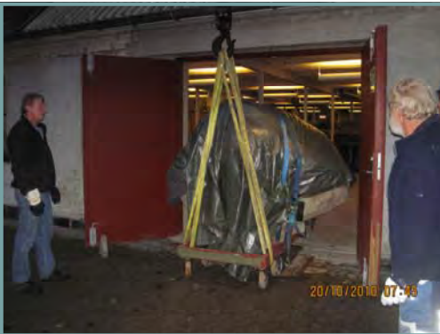
Stenen trækkes ud fra magasinet i Hillerød den 20. oktober 2010 kl. 07.45.