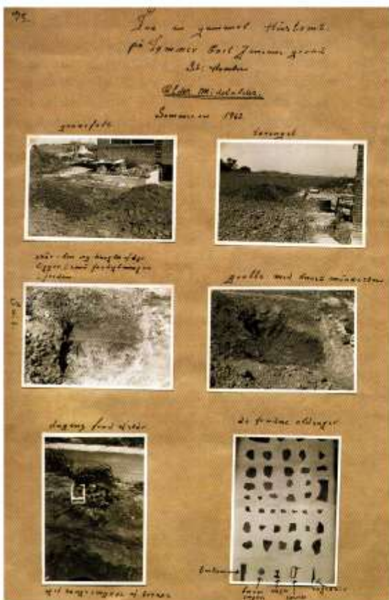
Figur 1. Side fra Hans Ove Niensens udklipshog med fotos fra udgravningen i Store Havelse.

Et nærmere kig på genstandstyperne afslører, at Hans Ove har været ganske heldig: Fiblen (fig. 2) er således det eneste eksemplar af denne type, som kendes fra museets virkeområde. Der er tale om en cirkulær bronzefibel i gennembrudt gittermønster med øsken. For ikke så længe siden var typen stort set ukendt, men med de seneste 20 års omfattende detektorbrug, er der kom-