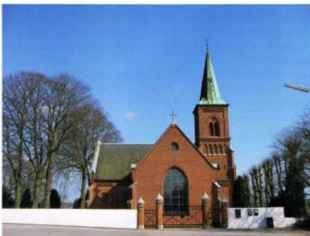
Vinderøds middelalderkirke, i og omkring hvilken denne historie udspandt sig, blev nedrevet i slutningen af 1700-tallet. I stedet opførtes Den Classenske Gravkirke med Classens gravgrotte. Gravgrotten blev bevaret, da også denne kirke blev nedrevet og den opførtes og indviendes i 1884.

Moralen af denne lille fortælling må vel være, at selv om man ikke kan tro på en gud, er det ikke godt ikke at tro på noget - og heller ikke godt at tro for meget. Historien viser, at man i begge tilfælde kan have svært ved at forstå andre.