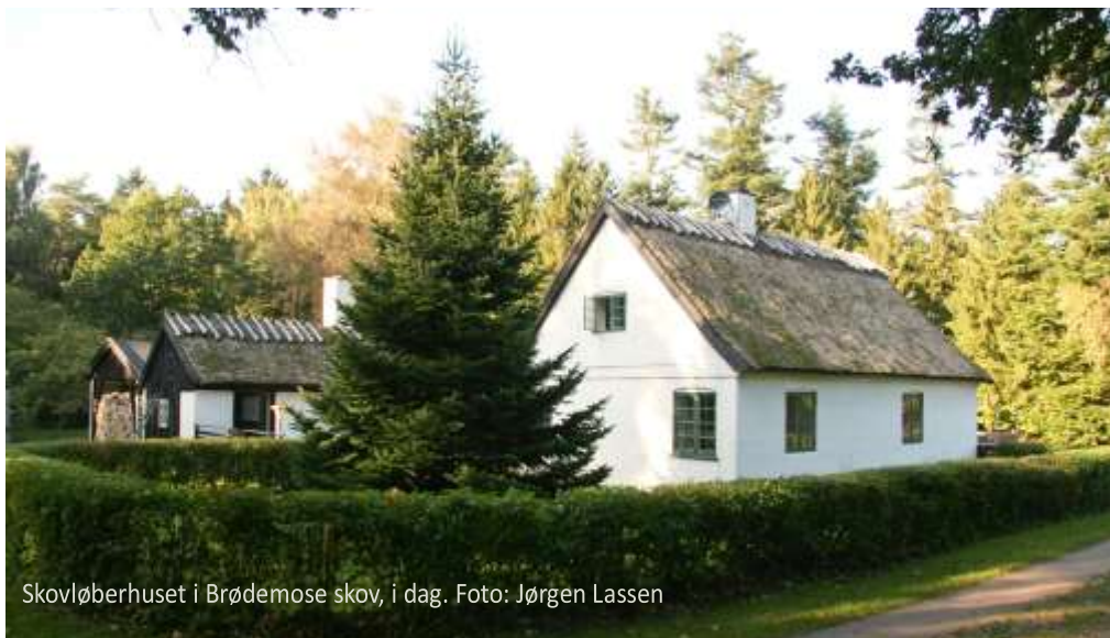
Skovløberhuset i Brødemose skov, i dag.

nakken kunne man også se, hvor der var markedsdage. Jævn døgn faldt altid på en onsdag.