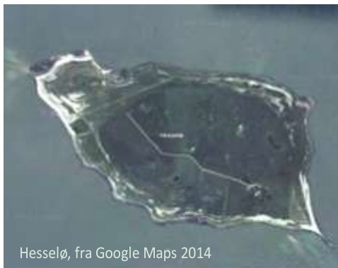
Hesselø