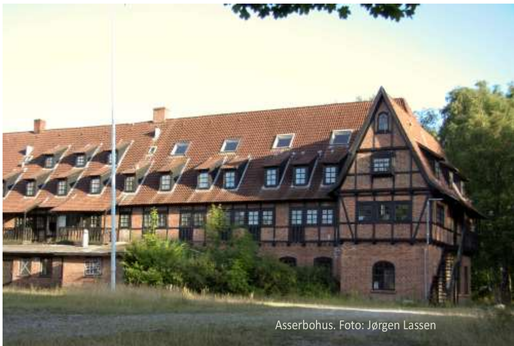
Asserbohus.