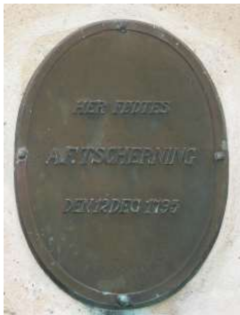
Mindeplade i bronze på Palæets vestgavl

I en taksationsforretning beskrives ejendommen på følgende måde: Huset har to skorste- ne, og tre udvendige trapper i sten samt tre kældertrapper, 2 udvendige fyldningsdøre og tre glatte døre. Til kælderen er der en trappe, der fører ned til syv enkelte rum. Overraskende meddeles det, at trappen går fra kælder til loft. Overalt i ejendommen var der pudsede vægge, og skiftevis murstensgulve og bræddegulve. I stuen var der indrettet værelser til tjenestefolkene og et spisekammer. Fra de to entréer førte en halvtrappe fra stuen til 1. sal. Den smukt indrettede første sal eller bel-etage