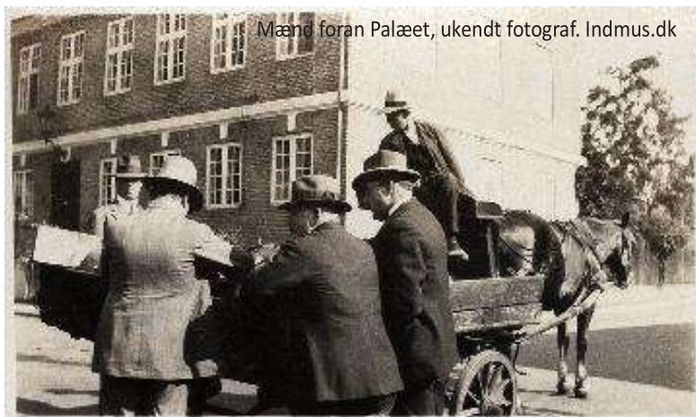
Mænd foran Palæet

Husets søn var en ener. Han gik sine egne veje og havde sine meningers mod. I første omgang havde han sammen med en kammerat overvejet at drage til Sydamerika for at kæmpe under Simon Bolivars faner, men det projekt måtte de opgive. Det kom derfor som en befrielse, da han i 1815 blev tilbudt at slutte sig til det danske korps, som under ledelse af Frederik af Hessen skulle hjælpe englænderne mod Napoleon. Det berømte slag ved Waterloo gjorde imidlertid det danske bidrag overflødigt. Ved freden i 1815 blev det bestemt, at Nordfrankrig skulle holdes besat i tre år af de allierede tropper. Danmark skulle således deltage med 5.000 mand. Tscherning