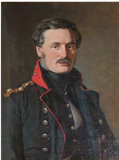
A. F. Tscherning 1851. maleri udført af C.A. Jensen (Frederiksborg Museet). Efter sigende lignede far og søn hinanden. De var begge mørke, høje mænd med et stort kvindetække.

det, at hans løsningsforslag er, at man hurtigst muligt i Frederiksværk anskaffer sig