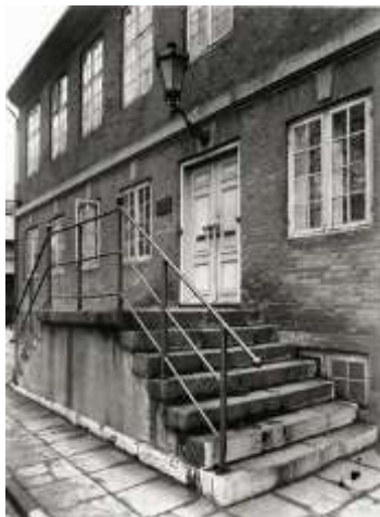
Trappen til Palæet, foto fra 1947.

27) De er i artiklen i øvrigt anvendt følgende arkivfonds: Artillerikorpset, Indgående breve 1737-1830, biografiske samlinger vedrørende slægterne Tscherning og Schumacher, Anton Frederik Tschernigns arkiv 1800-1844.