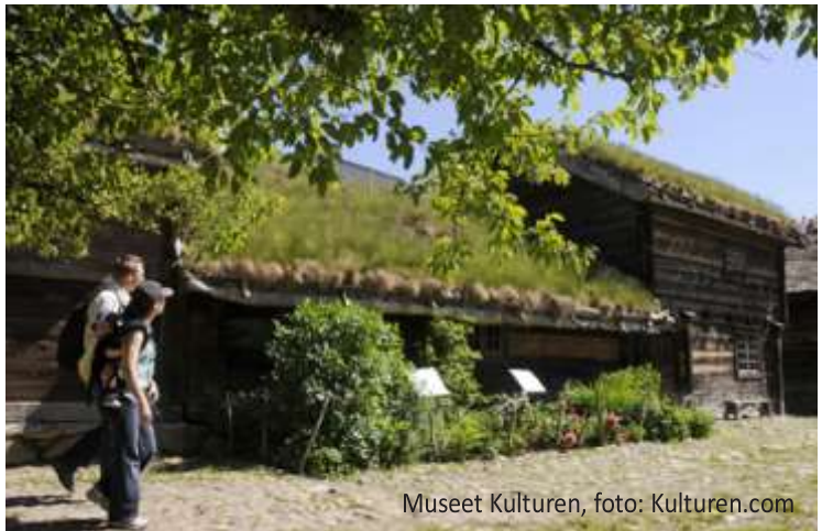
Museet Kulturen

Det er naturligvis diskuteret om disse ture er for dyre. 400 kr. kostede turen til Lund, men med bus, mad og drikke og gode oplevelser, kan det beklageligvis ikke gøres billigere. Man tør slet ikke tænke på, hvad det ville koste, hvis også planlægning og forberedelser skulle betales. Vi 43 som var med på denne tur fik nogle fine og gode oplevelser.