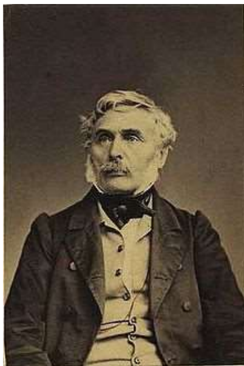
Tscherning på sine ældre dage. Fotografiet var opfundet og fanger her den aldrende mand. Han var på ingen måde affældig. Han var politisk aktiv og en passioneret fortaler for bøndernes stilling i samfundet.