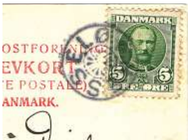
Fig. 6 Hesseløs første poststempel, et såkaldt stjernestempel (sjældent!), på et postkort sendt via Nykøbing Sjælland til Hjelm Fyr den 2. januar 1909.

Som det sikkert fremgår af ovenstående tekst, er der en del uafklarede spørgsmål med hensyn til Hesseløs posthistorie, bl.a. kronologien. Det skyldes, at Postvæsenets arkivalier vedrørende