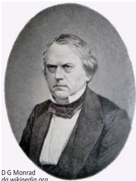
D G Monrad da.wikipedia.org

1800-tallets liberale troede på et tærskelprincip: En stat måtte have en vis størrelse for at kunne overleve militært, økonomisk og kulturelt. Danskerne havde lige siden »tabet af Norge i 1814 frygtet, at staten var blevet for lille. Da det danske folkesprog i Slesvig efterfølgende blev trængt tilbage, opstod der panik. Man frygtede for det første, at Danmark uden Slesvig ville gå under. For det andet frygtede man