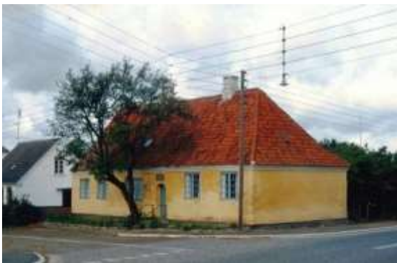
Rytterskolen i Lille Heddinge

Kong Frederik den Fjerde fik virkelig held med at lave langtidsholdbare bygninger. I Ølsted blev det til ca. 220 års uafbrudt brug som skole og lærerbolig. Der er sket noget med de fleste rytterskoler i landet, nogle er brændt og aldrig genopbygget, andre er fjernet til fordel for parkering og et utal er gjort større, således også i Ølsted. Den er forlænget ca. 3 m. i hver ende, til fordel for både skolestue og lærerbolig. Det er muligvis sket omkring 1790'erne, da de fle-