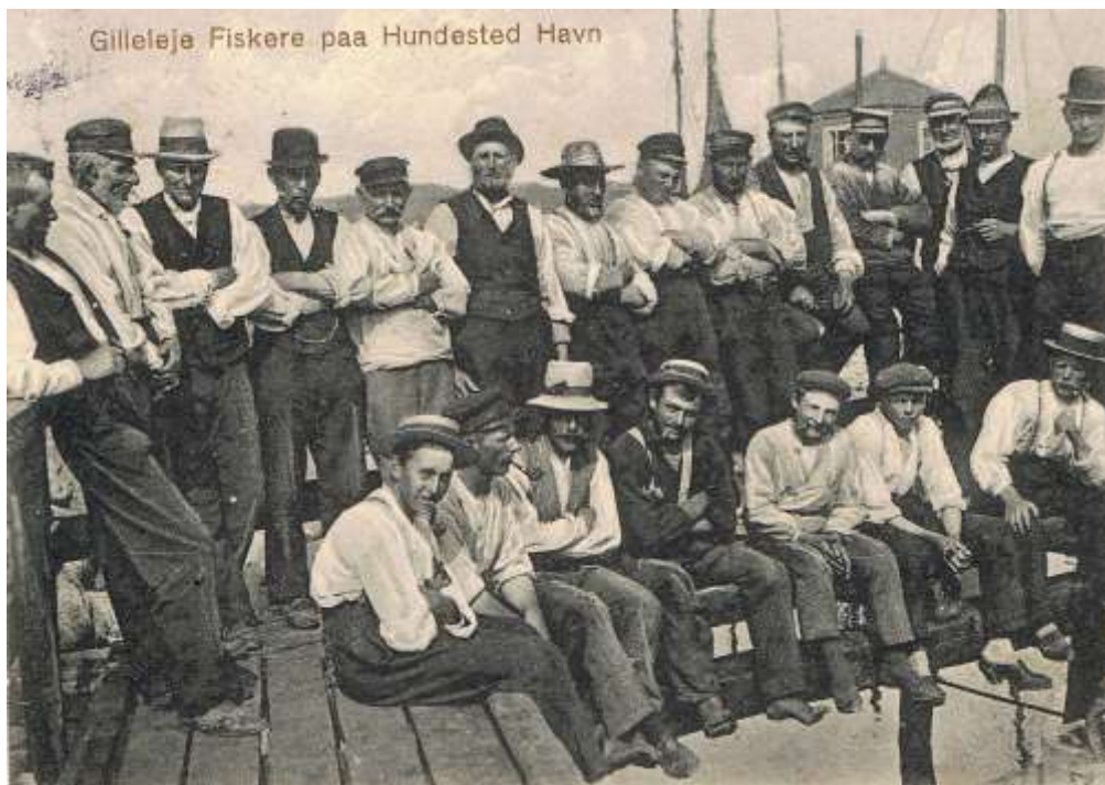
Fig. 4 Postkort fra omkring 1915. Disse fiskere fra Gilleleje er godt nok fra et langt senere tidspunkt, men ser ikke desto mindre ud til at kunne spinde en god ende - ganske som deres forfædre!

Forhistorien tog sin begyndelse i 1830, hvor Sprogø Fyr blev slukket for at forhindre, at skibe sneg sig igennem bæltet uden at betale