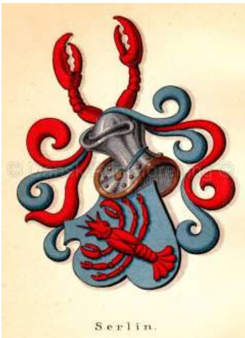
Fig. 2 Laurids Iversen havde fra 1523 Kongsgården i forlening. I 1529 blev han adlet, og her ses hans våbenskjold.