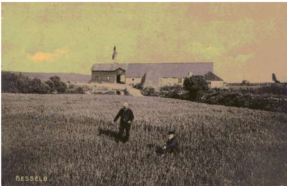
Fig. 9 Hesseløgaard. Postkort fra omkring 1915