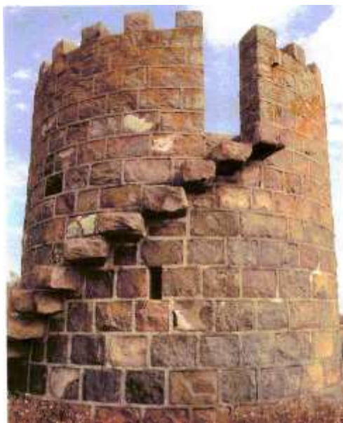
Fig. 8 Det smukke jagttårn er seks meter højt og opført i granit