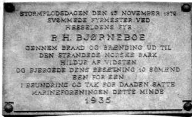
Fig. 10 Mindestenen fra 1935

Ellers var det mest i forbindelse med isvintre, at Hesselø i disse årtier havde avisernes bevågenhed, fx den 1. februar 1937, hvor man kunne læse, at øen var uden post paa ellefte Døgn. Det var ret uheldigt, fordi fyrassistent