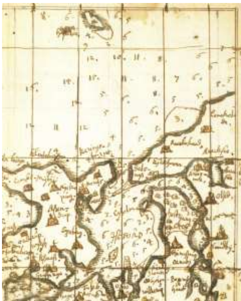
Fig. 1 Udsnit af svenskeren Dahlbergs kort over Danmark og Sydsverige (tegnet 1660 og udgivet 1690). Bemærk, at Hesseløs beliggenhed – mildt sagt – er fortegnet.

I år er det ti år siden, Hesselø sidste gang var i mediernes søgelys, nemlig i forbindelse med genopretningen af øens natur efter de voldsomme indgreb, øens nye ejer, firmaet Weibel Scientific , havde foretaget.