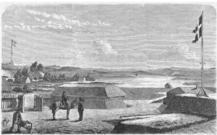
En skanse ved Mysunde.

Den nationalliberale presse var fyldt med forestillinger om, at man kunne slå Tyskland, men de nationalliberale toppolitikere gjorde sig ingen illusioner. Man vidste godt, at krigen ikke kunne vindes. Men det var heller ikke målet. Målet var at tvinge de neutrale stormagter til at gribe ind, så en forhandlet løsning kunne komme på plads, og her ville