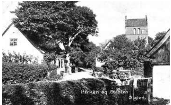
Postkort fra omkring 1900

Der er ingen tvivl om, kongen var meget stolt af sit skoleprojekt, når man så denne tekst. På hans kiste i Roskilde Domkirke er der på den ene side et billede af nogle børn, der står foran en rytterskole. Ølstedtavlen blev omkring 1970 af det gamle sogneråd flyttet til sogne-skolen; men blev ved menighedsrådets handel flyttet tilbage til Rytterskolen.