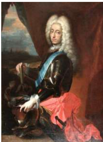
Frederik den Fjerde

De bedste virkninger af loven kunne spores i, at kongens søskende, prinsesse Sophie Hede-