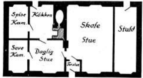
Grundplan af Fr. IV' Skoler.

De 12 rytterdistrikter er fordelt således: 6 på Sjælland, nemlig København, Kronborg, Frederiksborg, Tryggevælde, Vordingborg og Antvorskov. 3 i Jylland: Koldinghus, Skanderborg og Dronningborg. Fyn, Lolland og Falster