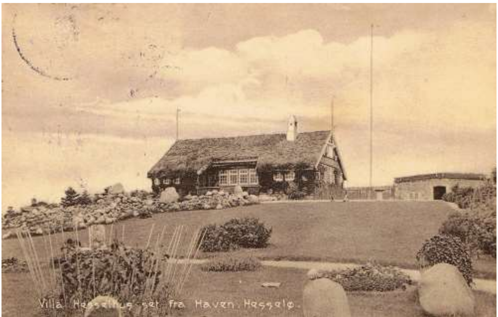
Fig. 7 Hesselhus set fra haven omkring 1915

stor Pejs, Hylder og Tallerkener langs Væggene optager Midten af Villaen og begrænses på Siderne af Sove- og mindre Opholdsværelser. Fra Salen er der til den ene Side Udsigt over Øen mod Sydøst og til den anden over Forstranden med de brogede Stude, Havet med de mange Skibe og Baade og Nordvestrevet med Sælerne, og denne Udsigt er, især ved Solnedgang aldeles uførlignelig.