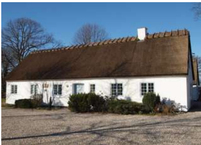
Rytterskolen i dag

I 1928 byggede man en forskole i Ølsted, også kaldet lærerindeskolen, idet der blev ansat en lærerinde til at undervise de små klasser indtil deres 10ende år. Det er huset Hovedgaden 7, i Ølsted, der i dag er Foreningshuset.