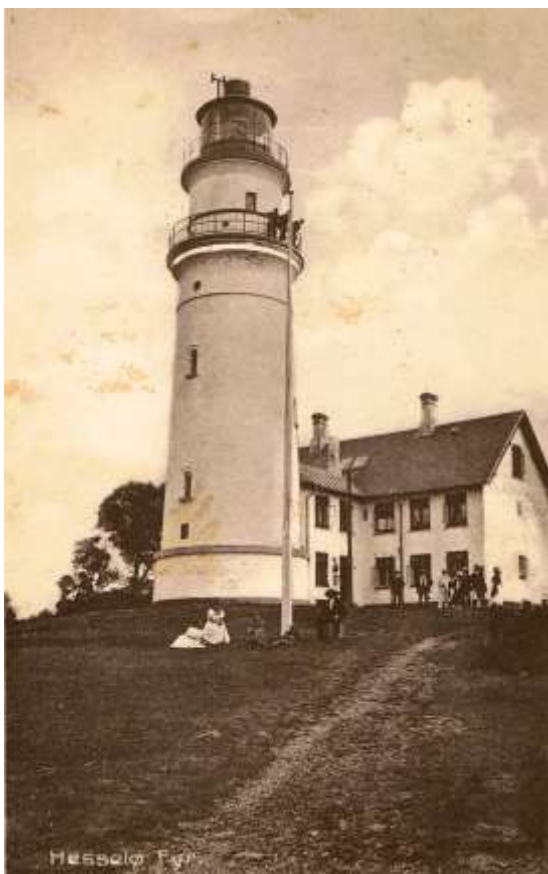
Fig. 5 Postkort fra omkring 1915. Fyrtårnet på Hesselø

Bygningen af fyrtårnet var desværre ikke nok til at forhindre strandinger ved Hesselø, fx gik