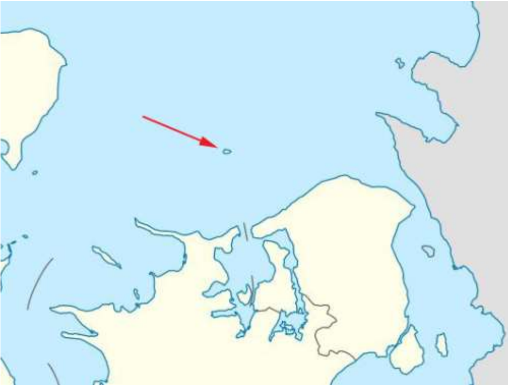
Hesselø's placering i Kattegat og et Google Maps luftfoto. Man aner sporene af landingsbanen. Mere om den i næste nummer!