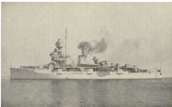
Fregatten Niels Juel, foto fra 1918. de.wikipedia.org

Fjenden var observeret lige ud for Hundested, én svær Krydser og to Torpedojagere. Endnu var Afstanden for lang, men kort Tid efter blev Anlægget sat i Gang, Kanonerne svinget ud og