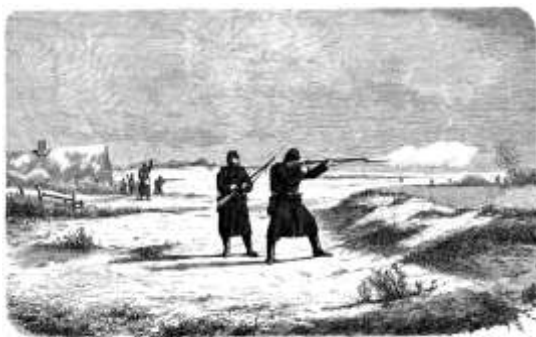
På forpost den 1. februar 1864.

Monrad var et geni, men han var også manio-depressiv, hvilket kan have påvirket hans risikovillighed i 1864. Her var hans rolle ikke heldig, men man bør ikke – som det sker i tv-serien – frakende hans planer enhver rationalitet.