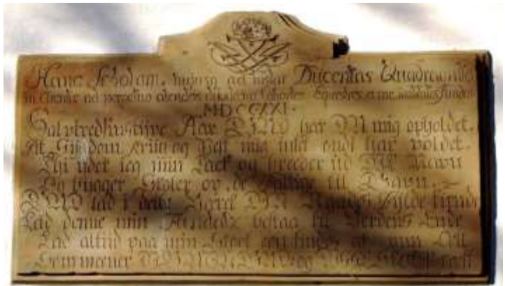
Frederik den 4.s tavle, som hænger på Rytterskolen i Ølsted