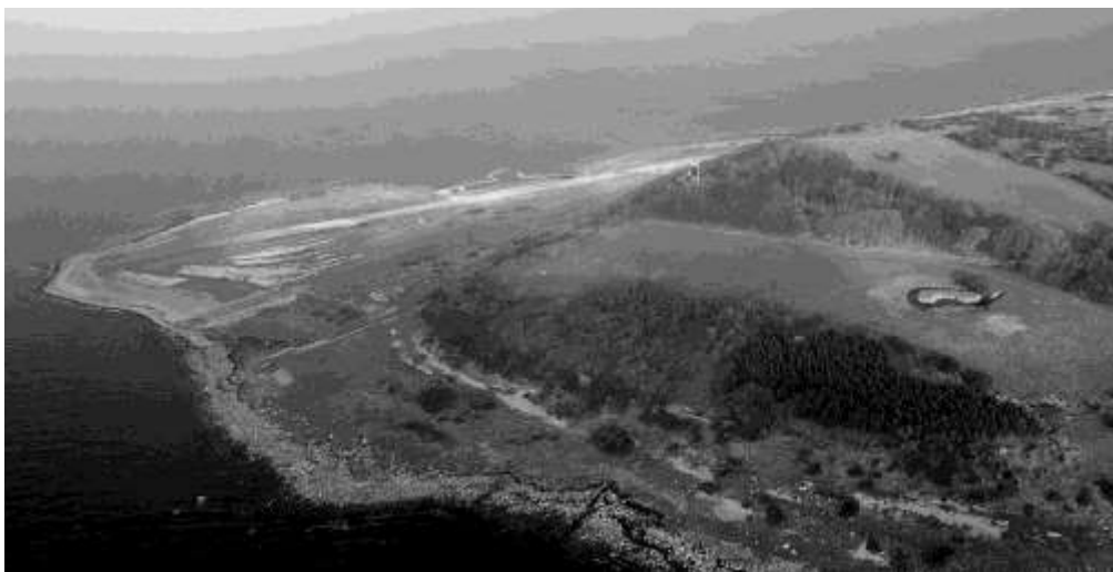
Hesselø november 2003. Den nye landingsbane og havnen ses tydeligt.

mindre ændringer for at forbedre sikkerheden. Vi beklager, at vi ikke var opmærksomme på reglerne.”