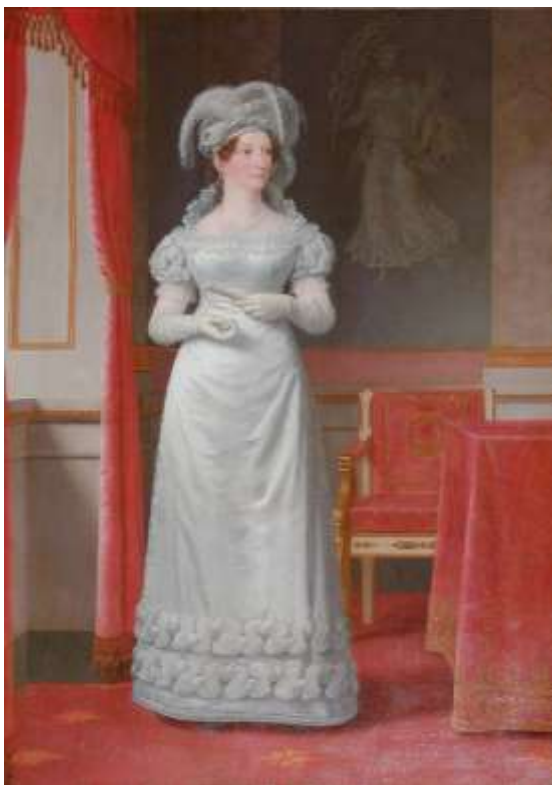
Marie Sophie Frederikke af Hessen-Kassel, C W Eckers-berg, 1826. Hun blev den 31-07-1790 viet med kron-prins Frederik, den senere konge Frederik 6. Dronning af Danmark 1808 - 1839.

Indbyggerne forundt adskillige befrielser, ret-tigheder og toldfriheder.