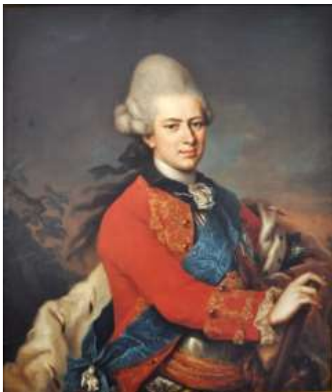
Carl af Hessen (19-12-1744 til 17-08-1836)

bør så meget mere anerkende den sidstnævnte en betydelig andel i disse stiftelser, som det er sikkert, at hans bror ikke ville have undraget ham en så stor andel af sin formue hvis han ikke havde anset dette forehavende for overensstemmende med konferensrådets velgørende tankesæt, hvis indsigter og varme patriotisme bidrager meget til at give nævnte stiftelser den mest udmærkede fremgang, og hvilken endnu dagligt stræber efter, dels gennem sin broders tidligere midler, dels gennem sine egne, at skabe et varigt eftermæle i sit fædreland.