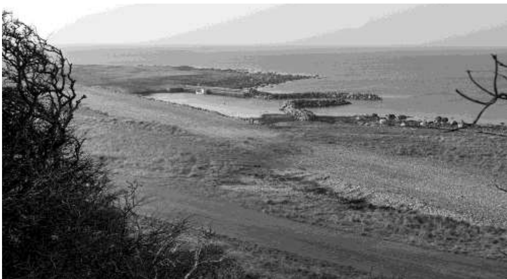
Hesselø. Havneanlægget med bølgebryder og bro.