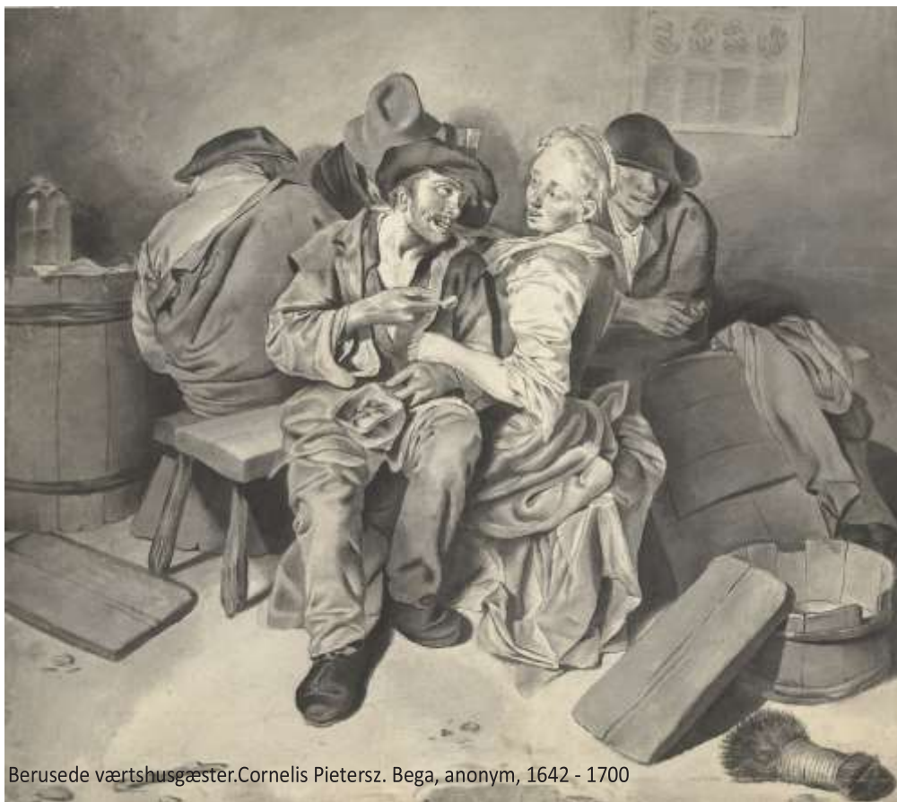
Berusede værtshusgæster. Cornelis Pietersz. Bega, anonym, 1642 - 1700

arbejdede med mere specialiserede og presti-gefyldte håndværk som sølvsmede og kortmager.