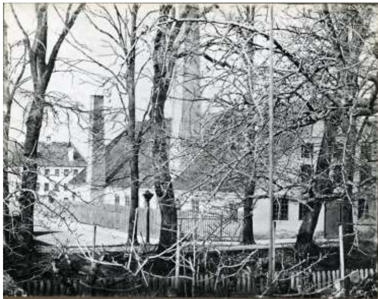
Kobbeværket i Frederiksværk.

Værket blev revet ned i 1907 og maskiner og