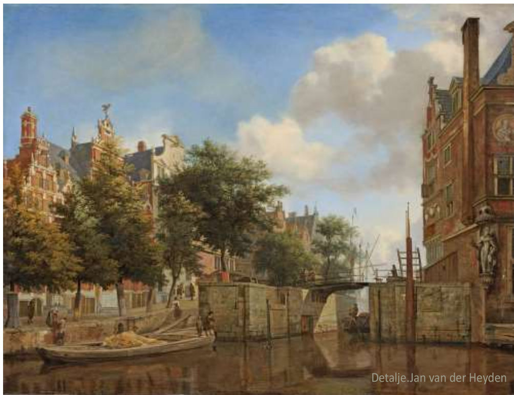
Detalje. Jan van der Heyden