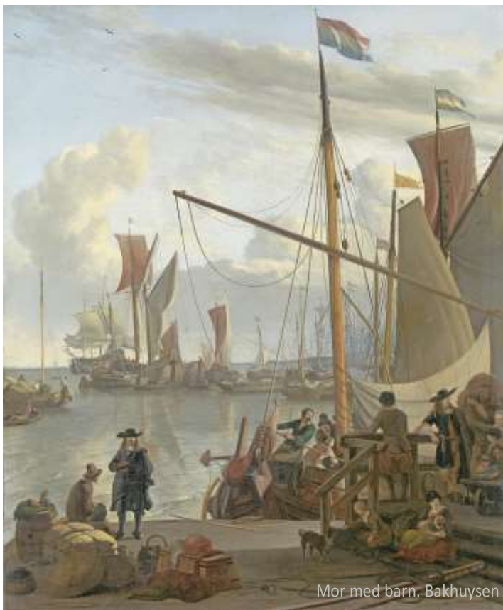
Mor med barn. Bakuysen

tig godt eksempel herpå er fire søstre fra Varde, som med få års mellemrum udvandrede til Amsterdam i midten af 1700-tallet. De har uden tvivl hjulpet hinanden igennem tilværelsen som indvandrere i byen. Eksempelvis er det let at forestille sig, at de ældste og først ankomne søstre har hjulpet de yngre med et sted at bo og at finde arbejde. Ligesom man kan forestille sig, at de i det hele taget har fungeret som hinandens sociale sikkerhedsnet.