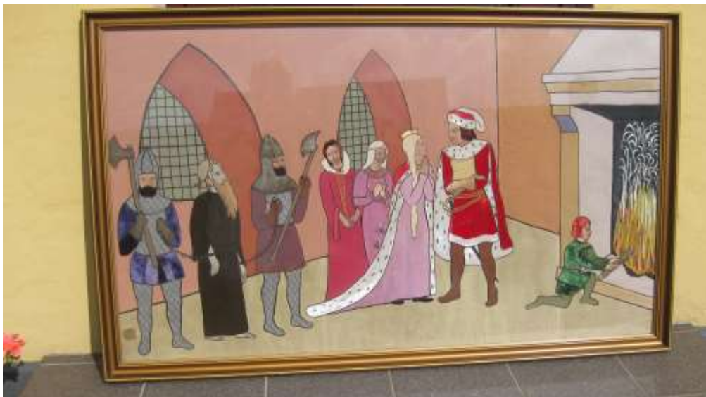
Dronningholm , broderet i stof. Billedet har jeg lånt af en af mine gode bekendte i Frederiksværk.

og nyde den smukke udsigt til Arresø. Dengang var fru Larsen indehaver, og i restauranten udstilledes mange flotte billeder om Dronningholms historie fremstillet af Gudrun Barfod, Auderød, i hendes specielle applikationsteknik.