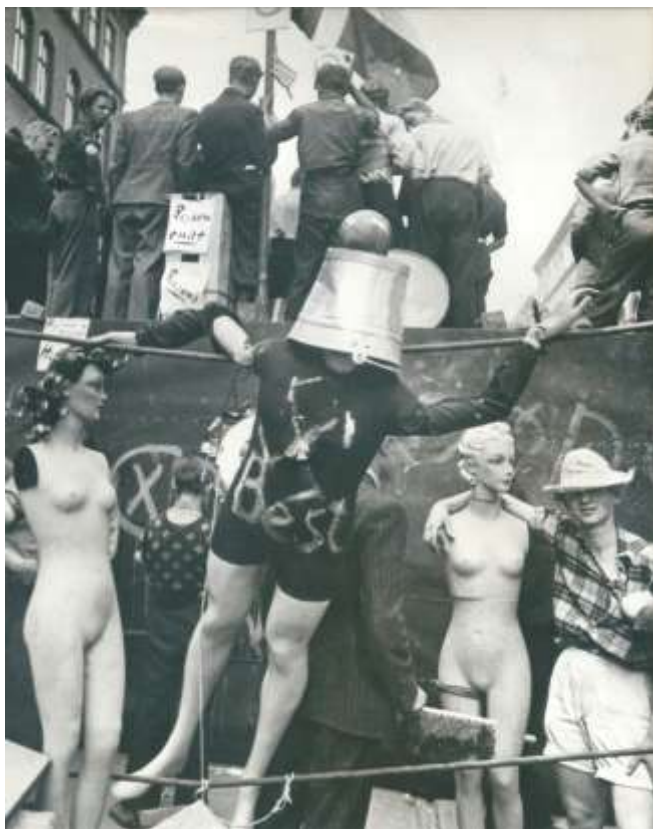
Den store barrikade på Nørrebrogade i København under folkestrejken i 1944 blev blandt andet bygget med inventar fra varehuset Buldog

Til gengæld fortsatte strejkerne. De havde fra første færd været modarbejdet af såvel ledende politikere som erhvervsorganisationer og den socialdemokratiske dominerede