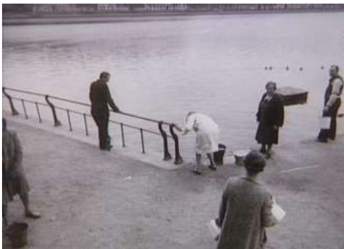
Tyskerne lukkede under folkestrejken i 1944 for vandet og gassen, så der hentes vand i Peblingesøen i København

dens nye udfordringer en såkaldt "gå-tidligt-hjem"-strejke blandt københavnske fabriksarbejdere. De skulle jo have otte timers søvn og otte timer hvile, og hvis de kom hjem fra arbejde som de plejede, kunne de jo ikke nå de otte timers hvile, inden de skulle være på plads i de sommervarme lejligheder i byen. De proklamerede ligefrem, at de ellers ikke kunne nå at passe deres kolonihaver! Strejken bredte sig de følgende dage, og selvom det tyske Dagmarhus allerede