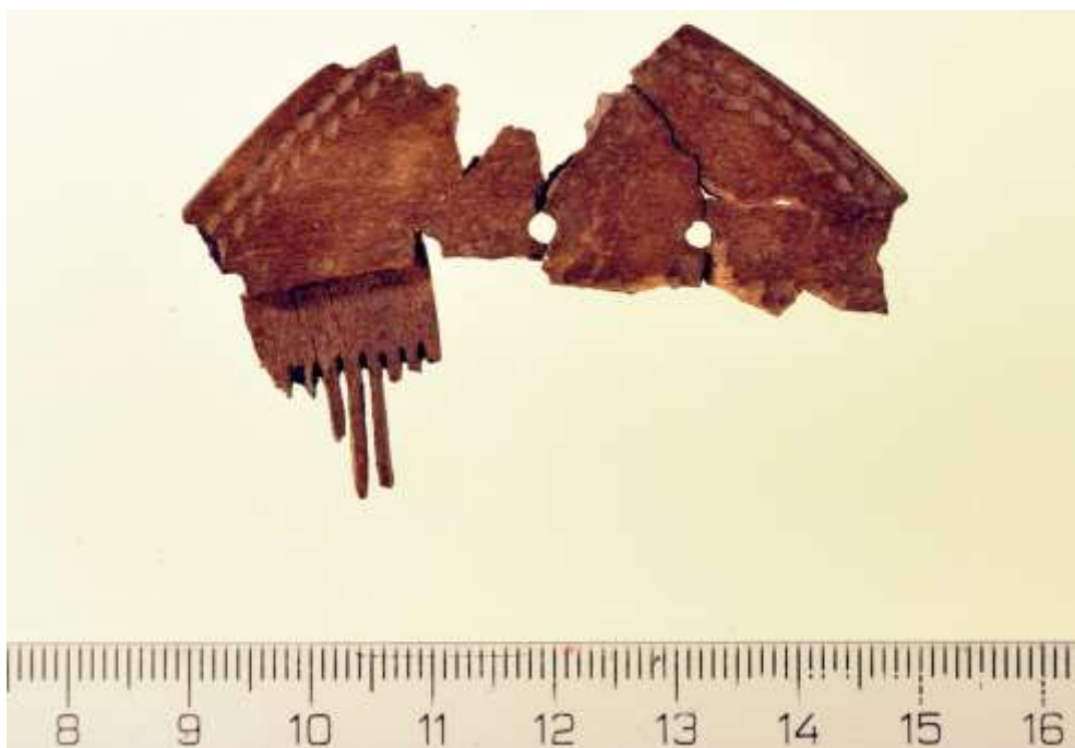
Figur 3: Den mest hele af de efterhånden mange fragmenterede kamme. Bemærk den fine ornamentik i kanten af kammen.

finder meget sjældent affald på jernalderbo-pladserne i Nordsjælland. Dette har ofte resulteret i en opfattelse af, at man i jernalderen må have været meget fattige på disse kanter.