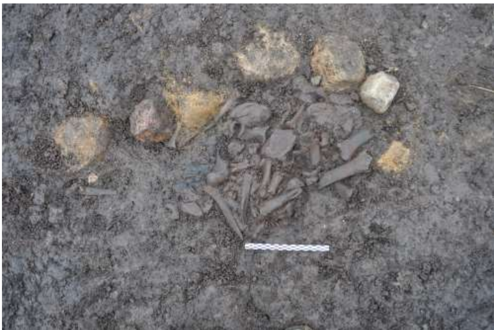
Figur 5 En af flere ofringer af dele fra ungtyre. I dette tilfælde er ofringen markeret med sten omkring

for at være særdeles nyttige og indtog en klar førsteplads som husdyr, ikke mindst kan dette spores i de kultiske ritualer både i grave og i andre ofringer, hvor de hyppigt indgår. Sallerpetermosen er den ene hund ofret i komplet tilstand sammen med et lille lerkar og et kohorn. Der er ingen tvivl om, at der er tale om et offer, idet kombinationen af helt dyr og helt lerkar fremstår meget iscenesat i modsætning til affaldet, der itubrudt er smidt til højre og venstre uden noget system. I det andet tilfælde er der tale om dele af en hund sammen med en svinekæbe. Selvom hunden er parterret, er man ikke i tvivl om, at der er tale om offer, idet hunde ikke blev spist og derfor ikke kan indgå i husholdningsaffaldet. Dertil kommer, at fundet fremstod som en kompakt klump, som om det oprindeligt har været indpakket i et stykke klæde eller lignende.