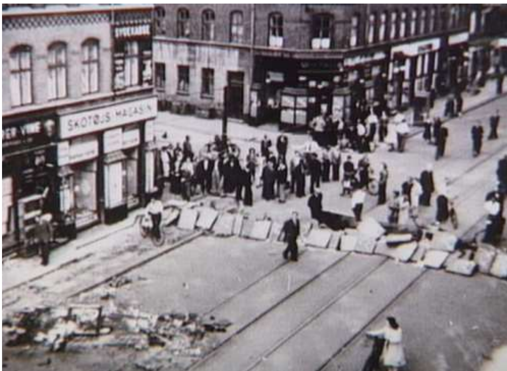
Barrikade i Istedgade i København under folkestrejken i 1944

ge, det største kvantum under besættelsen. Så snart bomberne var placeret og lunterne klar til at blive antændt, satte sabotørerne samtidig luftalarmerne i gang, således at arbejderne kunne blive evakuret fra området, og BOPA-folkene kunne smutte væk fra stedet i det almindelige virvar. Der blev ødelagt for knap 10 millioner i datidens penge, svarende til omkring 200 millioner i dag.