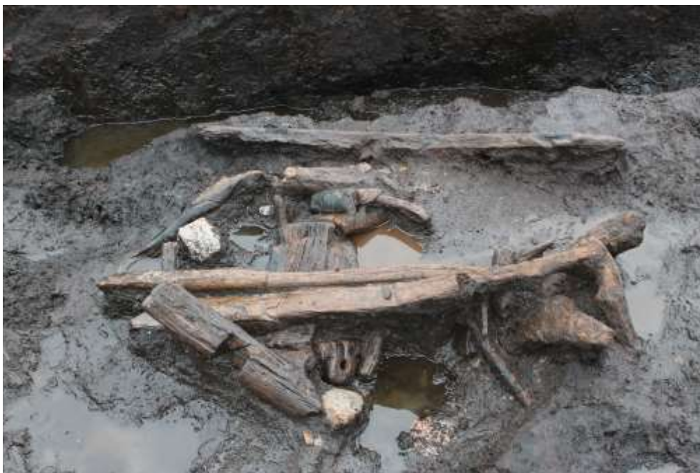
Figur 6: En samling af trægenstande, der er nedlagt i en tørvegrav – måske som offer?