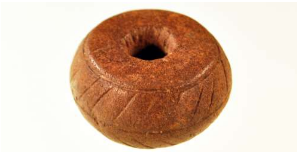
Figur 4: En tenvægt i ben bemærk også her den fine ornamentik. Tenvægten er ca. 5 cm i diameter

dette betyder muligvis, at andre moser ved andre bopladser måske kunne have rummet et tilsvarende materiale, hvis vi havde udgravet disse. En erkendelse, der har givet os kuldegysninger ned ad ryggen, for hvor mange moser og dermed fund har vi overset igennem tiden? Men sådan er arkæologi, vi ved ikke alt på forhånd, men er nødt til at samle små brudstykker sammen i håbet om stille og forsigtigt at danne et billede af forhistorien og hele tiden blive klogere på den.