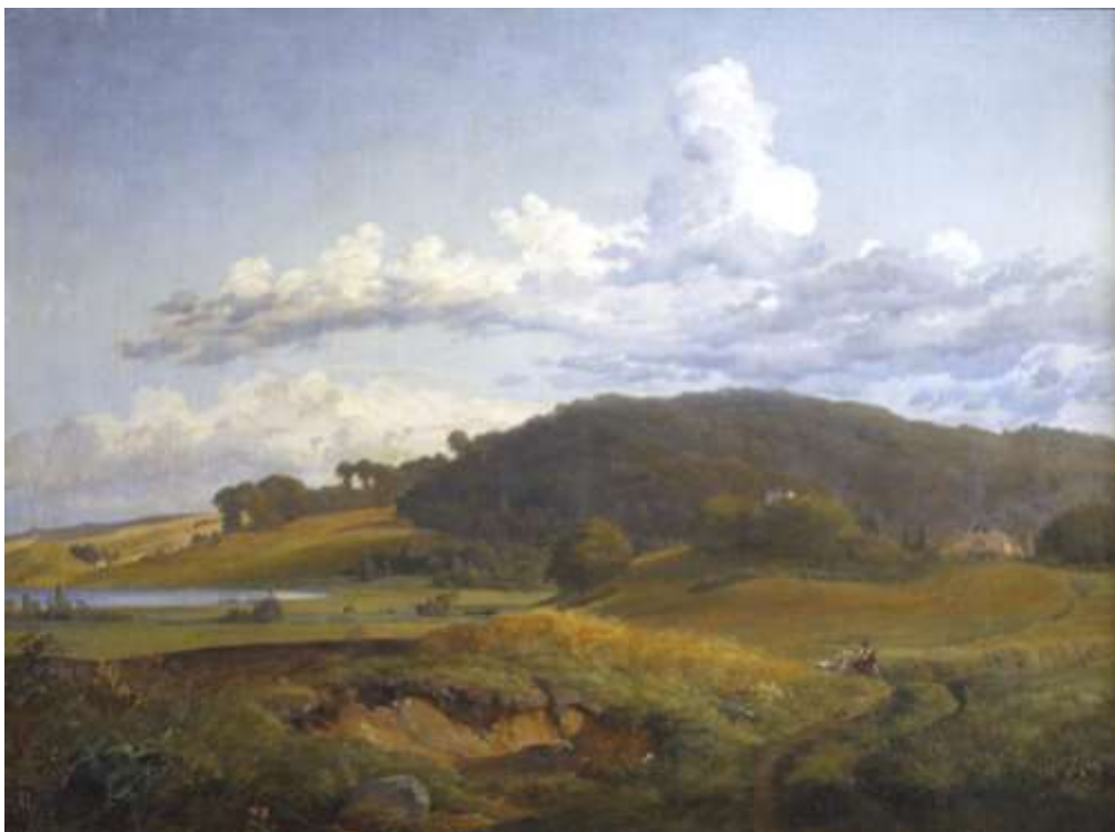
Udsigt ved Vinderød mod Høbjerg ved Frederiksværk med Lundbyes forældres hus, 94,2x125,5 cm, 1839.

forældrene i Frederiksværk tegner Johan Thomas Lundbye mange skitser omkring Vinderød og Arresødal, men ingen fra byen eller Værket. Han er stærkt optaget af tanken om at skabe billeder af det "nationale danske" og erklærer at ville "male det kære Danmark". Om vinteren i det lune atelier omsættes sommerens skitser til de stort komponerede oliemalerier.