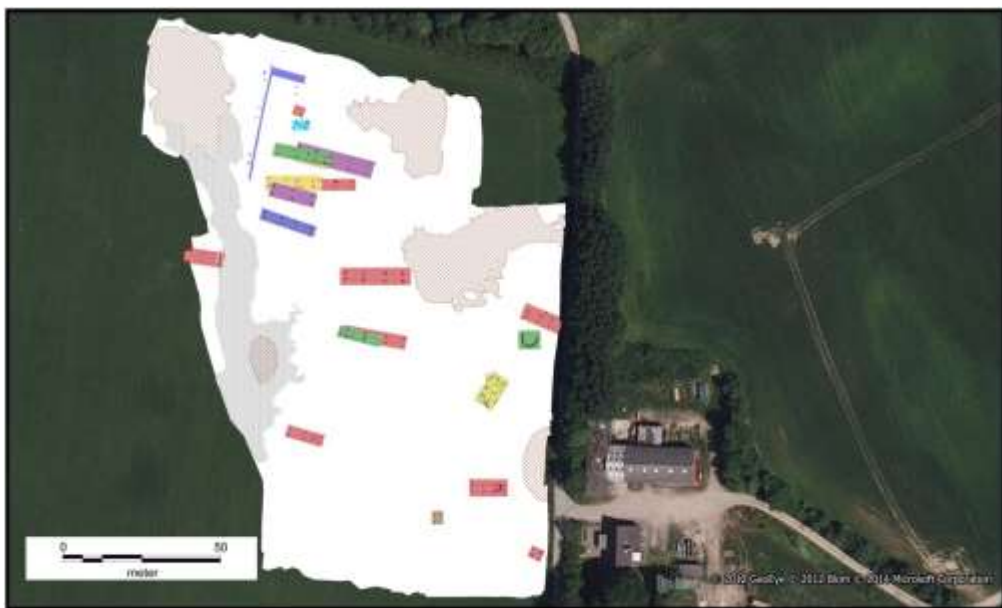
Figur 2: Udgravningsplan over en lille del af udgravningerne, men der hvor hovedparten af de omtalte fund stammer fra. Den omtalte indhegnede gård og de tilhørende moser ligger øverst på kortet.

hvordan de havde været udnyttet i oldtiden. Men efterhånden som vi fik skrællet overjorden af, var det tydeligt, at der har været beboelse på flere af de små knolde imellem mosehullerne, og at man havde anvendt de små moser på forskellig vis. Vi har således fundet en større boplads, der har været beboet i flere omgange i løbet af oldtiden, men især i jernalderen. Her har de enkelte gårde ligget med de små mosehuller imellem sig (Figur 2).