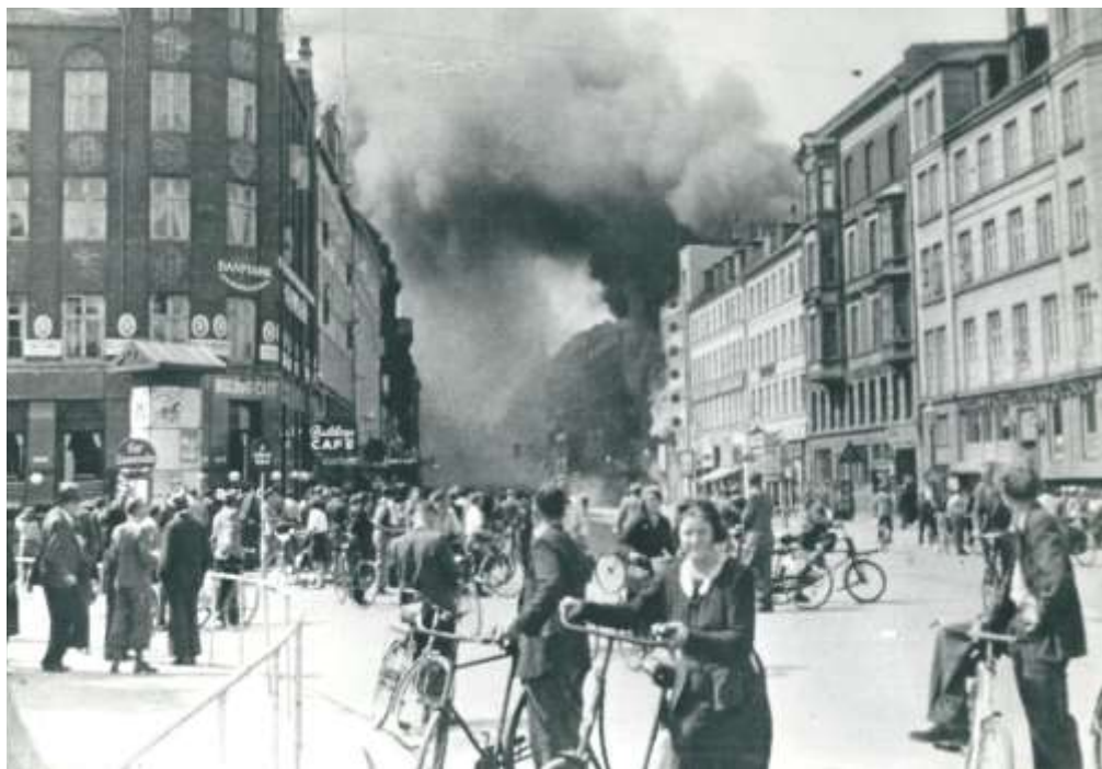
Varehuset Bulldog på Nørrebrogade i København er stukket i brand af demonstranter under folkestrejken i 1944

fagbevægelse, der alle frygtede, at tyskerne ville afbryde samarbejdet med det eksisterende departementchefsstyre og indføre et rent militærstyre. Men Frihedsrådet blev ved at opfordre til at fortsætte strejkerne, indtil kravene var indfriet, og det var først, da der begyndte at opstå sympatistrejker rundt om i provinsen, at besættelsesmagten krøb til køret og bekendtgjorde, at Schalburgkorpset ville blive trukket tilbage og spærretiden ophævet. Man ville ikke risikere en gentagelse af Augusturolighederne året før. Også Dagmarhus havde en overordnet interesse i, at samarbejdet med de danske myndigheder fortsatte, og samfundet blev ved at producere. I løbet af de næste dage ebbede strejken ud. Den var endt med en kæmpesejr til Frihedsrådet og et ydmygende nederlag til besættelsesmagten og