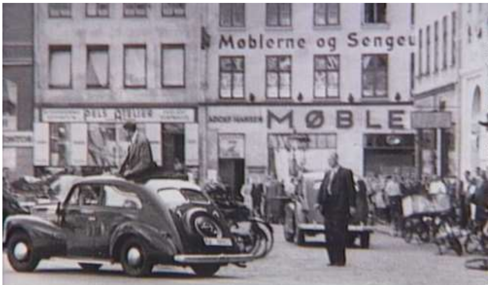
Tysk politi i aktion på Kulturvet i København under folkestrejken i 1944 (Frihedsmuseet)

(DISA), fandt sted 22. juni 1944 – på treårsdagen for Tysklands angreb på Sovjetunionen og dermed også for ulovliggørelsen af det danske kommunistparti. Det var en dristig aktion mod fabriksanlægget, der var bevogtet af både sabotagevagter og regulære tyske soldater - og som derudover stod i direkte forbindelse med tyske forstærkninger i området, hvis noget skulle ske. Aktionen foregik ved højlys dag og var en stor succes. Det lykkedes sabotørerne at komme ind på området gennem brug af list, herefter fik man samlet vagtpersonalet, uden at tyskerne opdagede noget, og med lastbiler kørte man sprængstoffet ind på området og placerede sprængstoffet i den aflange og dengang nyopførte hal. Samlet set blev 400 kilo trotyl anvendt ved denne sabota-