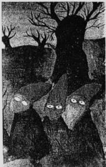
Vætter i Scherfigs streg