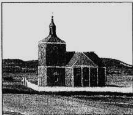
Classenske Gravkirke i Vinderød 1795 - 1883. (Maleri af J.Th. Lundbye 1837)

ene fik rigtig fart, da mennesker fældede store dele af de skove, der en-