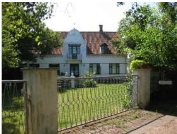
”Skansegaarden” i Hundested