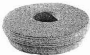
Agatslibesten fra Frederiksværk