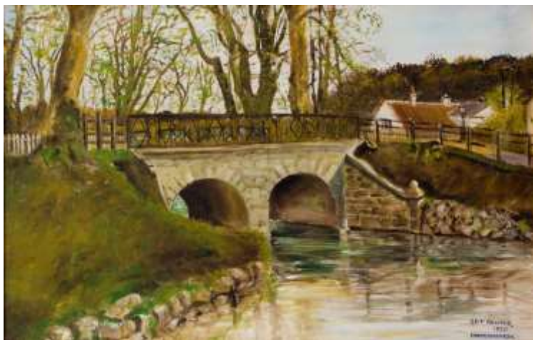
Arresødalbroen, hvor Agatslibemøllen lå. Maleri af Leif Wegener 1920. Foto: Torsten Møller Madsen, Galleri GAL's udstilling maj 2010

Men allerede langt tidligere har bygningen påkaldt sig betydningsfuld national interesse. Den 3. september 1962 kunne man således læse i Berlingske Tidende en artikel