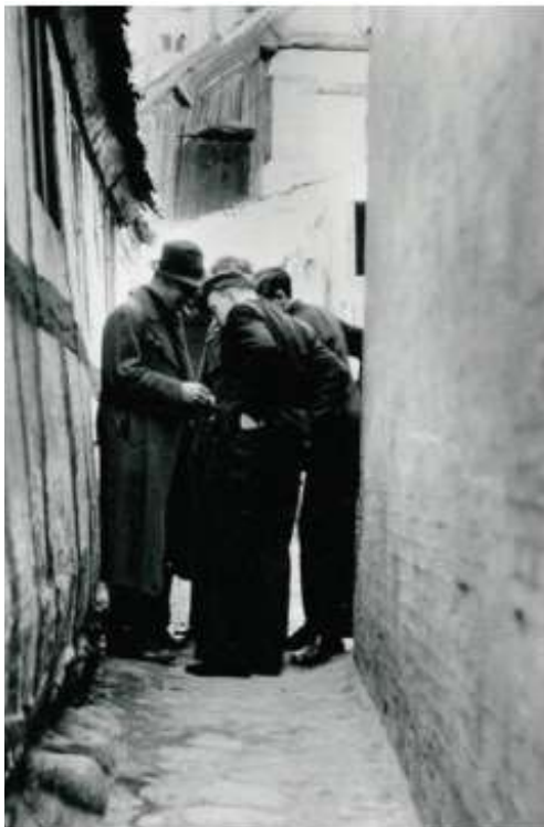
Et sjældent billede af sortbørshandel, her fra Ålborg.

Men hvad er kriminalitet? Alle samfund har nogle love for, hvad der er rigtigt og forkert, og den lovgivning er typisk udviklet gennem generationer, hvor man langsomt men sikkert får etableret normer for, hvad man må og ikke må – og i forlængelse af dette, hvis noget er ulovligt – hvor ulovligt er det? Skal man idømmes en bøde? Fængselsstraf? Dødsstraf? Et samfund kan ikke fungere, hvis alle gør, som de