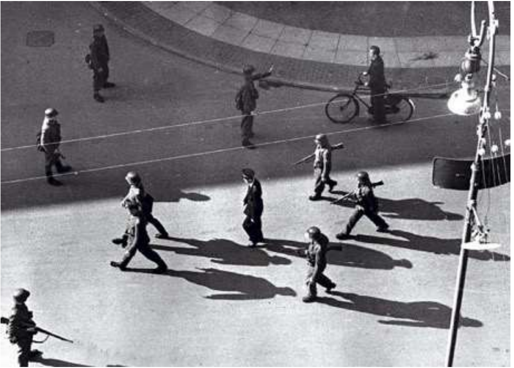
Politimand eskorteres væk 19. september 1944

simalpriser på varer. Dette blev gjort for at forhindre hamstring og mangelsituationer, og ordningen lykkedes over al forventning. Der var ikke varemangel i Danmark under besættelsen, selvom visse varegrupper naturligvis var stærkt begrænsede eller helt udgik af sortimentet. Anklagemyndigheden i krisesager blev udøvet af politimestrene, da kriminalitet blev behandlet som politisager og ikke straffelovssager. Hvilket primært var af hensyn til sagernes omfang og ønsket om en hurtig behandling.