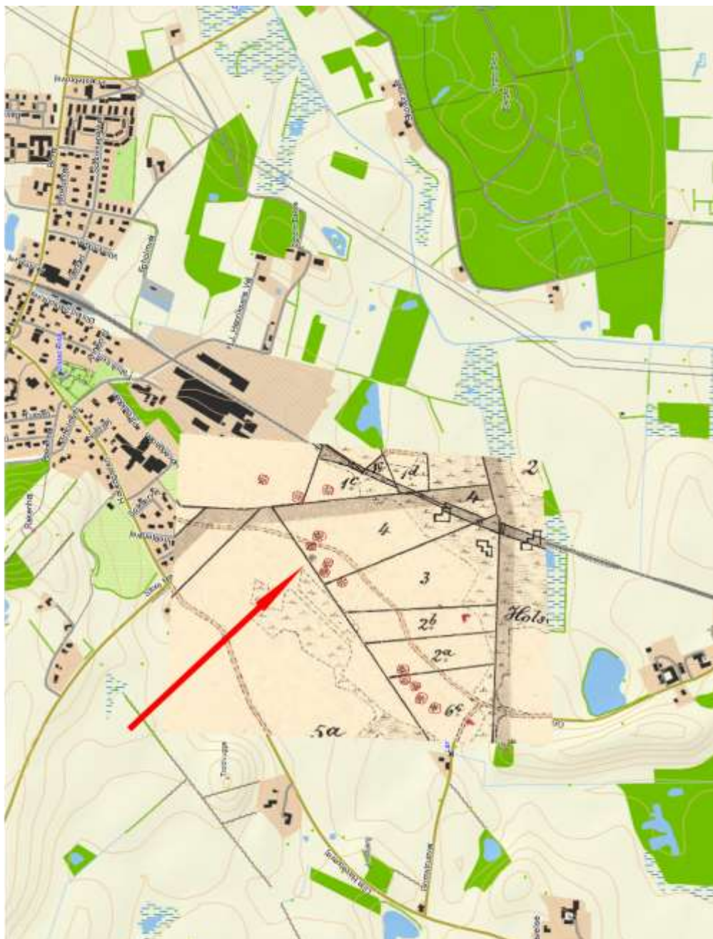
Kort over Ølsted i dag. Oven på dette er lagt et gammelt matrikelkort, der viser, hvor mange gravhøje, der har været, men som nu er nedpløjede (med rød ring). Pilen viser mod Viebjerg Højen, se artiklen på næste side. Grafik: Torsten Møller Madsen