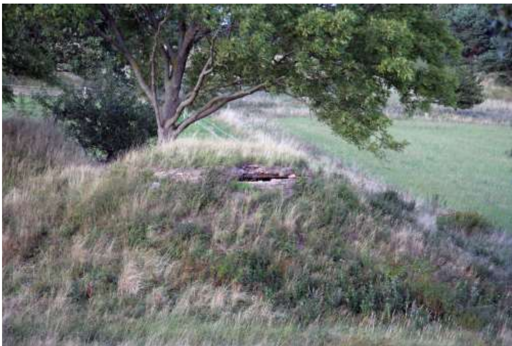
Et af de mere groteske eksempler på en ødelagt gravhøj, som trænger til restaurering. En af Sonneruphøjene er udhulet med en stor vandtank, som bønderne i Sonnerup i sin tid installerede.

den smukt beliggende høj øverst på Viebjerg syd for Ølsted og den mægtige Bomhøj syd for St. Havelse ved Store Havelsevej. Det er sket for kommunens regning i et eksemplarisk samarbejde med ejerne.