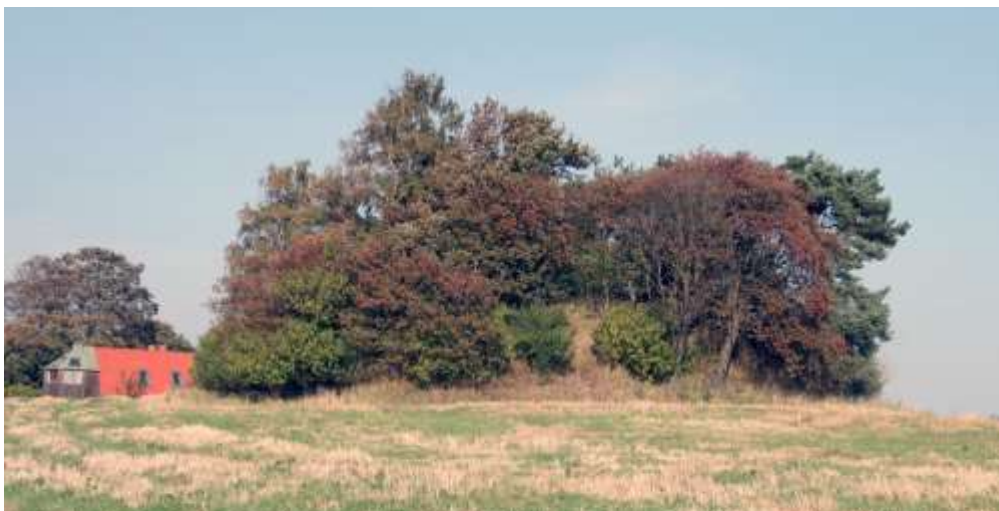
Bomhøj ved Store Havelsevej 145 før rydningen. I den tilstand kunne den nemt opfattes som en lund.

landskabelige æstetik og synliggørelse af den betydningsfulde og spændende kulturarv, hvilket også giver mulighed for en seriøs formidling af den store fortælling.