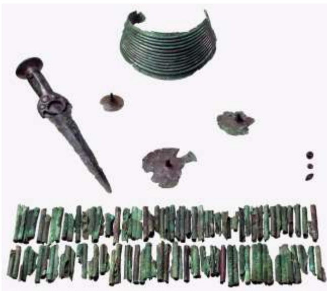
Fund fra en bortpløjet gravhøj ved 7-høje ved Melby. Det rige fund i en kvindegrav omfatter en fuldgrebsdolk på ca. 27 cm. i længden, en halskrave, to tutuli (smykkeplader), bælteplade, et stort antal rør til snoreskørt og 3 perler.

tørre områder øverst i højen og de fugtige områder centralt i højen.