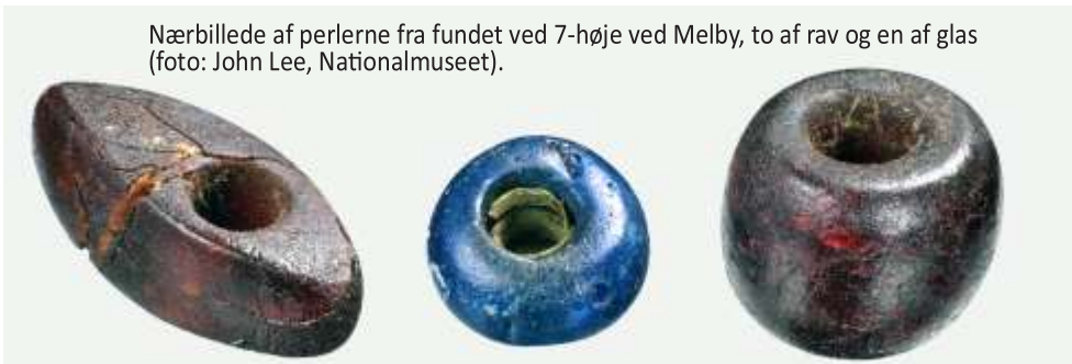
Nærbillede af perlerne fra fundet ved 7-høje ved Melby, to af rav og en af glas (foto: John Lee, Nationalmuseet).

Der er flere formål med pleje af gravhøjene: beskyttelse af indholdet, fremme den