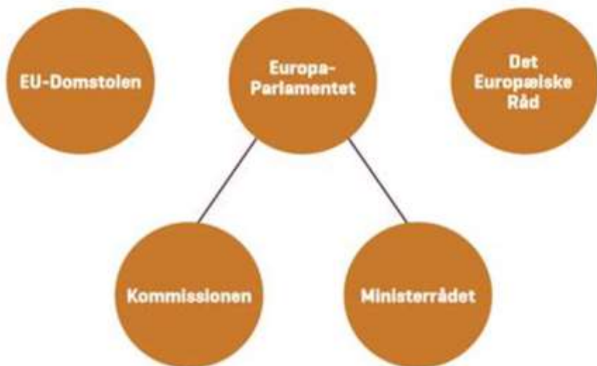
Figur: EU's centrale institutioner

dene, og Det Europæiske Råd består af alle statsministrene. Ved EU-domstolen er alle medlemslandene repræsenteret, herunder også Danmark.