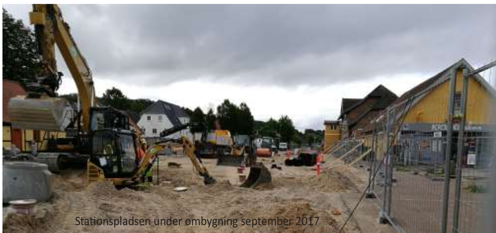
Stationspladsen under ombygning september 2017

Med venlig hilsen, Jørgen Tved, Skansevej 30 B, 3390 Hundested