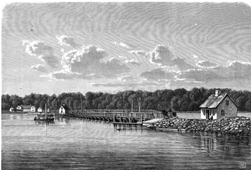
Ponton- broen Kron- prins Frede- riks Bro 1868.

borgere lod derfor opføre pakhuse for at øge handelen med bl.a. korn. Der blev også anlagt en simpel skibsbro i træ, som senere afløstes af en skibsbro i sten.