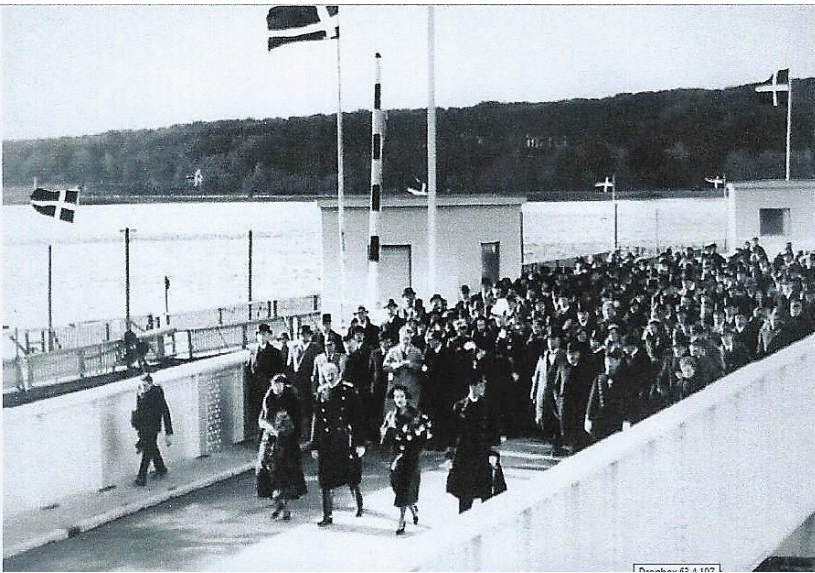
Broindvielsen af Kronprins Frederiks bro i 1935 blev forestået af Kong Christian X og Dronning Alexandrine samt det nygifte kronprinsepar, Kronprins Frederik og Kronprinsesse Ingrid.