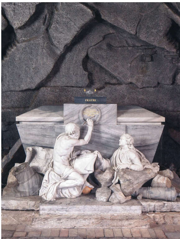
Classens gravmæle i Vinderød Kirke, hvor Argua hviler på 'Prøven'.

Det var en nyhed, der nåede den nationale presse. I Kjøbenhavns