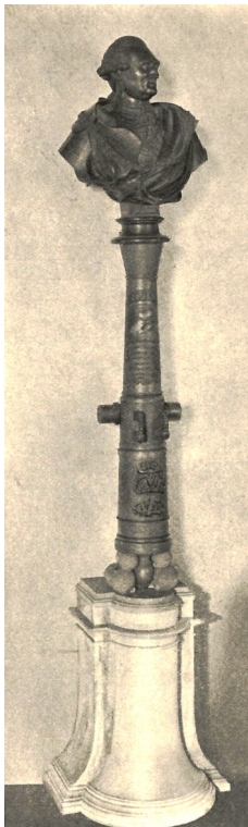
Frederiksværks mest berømte kanon - Prøven.

at udbore og afdreje de kanoner, som kongen havde bestilt. Derfor havde det ikke været muligt at afregne for det udførte arbejde, hvilket havde sat Classen under