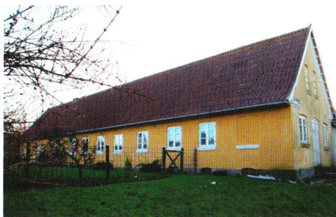
Kongeværelset" er 3. vindue fra højre

I værelset var der et lille vindue, som vendte ude mod haven, og langs den ene væg en jernseng med messingkugler ved benenden og hovedgærdet. Ligeledes var der et lille bord med skuffe, en lille stol og servante med stel. Værelset, der sidenhen også har fungeret som børneværelse, blev i mange år kaldt "Christian den tiendes værelse" eller "Kongeværelset".