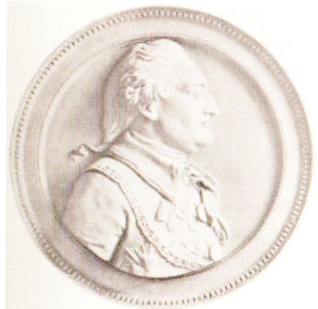
Johan Frederik Classen GENERALMAJOR

lagt bestemmelserne om hoveri og stavnsbånd.