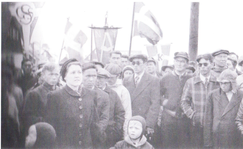
Fejring af befrielsen i Godthåb. Bemærk sportsforeningen Aqigssiaq s fane.

havde allerede i 1934 stiftet landets første sportsforening "Aqigssiaq", og under krigen fik han en ungdomsforening op at stå. Det faldt myndighederne for brystet, og han blev derfor sendt til Egedesminde. På efterskolen arbejdede han sammen med Mikael Gam - senere grønlandsminister - som var forstander hér.