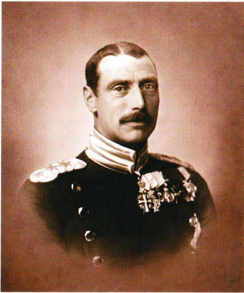
Prins Christian som voksen: Kong Christian den Tiende

Finder man et gammelt postkort, kan man se den gamle stavemåde. Ligeledes kan man ved besøg på Ølsted kirkegård se adskillige gravstene med bynavnene Store Hagelse og Lille Hagelse.